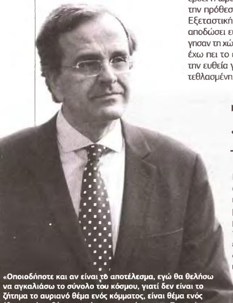
«Οποιοδήποτε και αν είναι το αποτέλεσμα, εγώ θα θελήσω να αγκαλιάσω το σύνολο του κόσμου, γιατί δεν είναι το ζήτημα το αυριανό θέμα ενός κόμματος, είναι θέμα ενός έθνους, είναι θέμα του τόπου μας», τόνισε ο κ. Σαμαράς.

Ο Αντώνης Σαμαράς βρίσκεται σήμερα στην Ισπανία, ενώ αύριο θα επισκεφτεί και την Πορτογαλία. Στόχος του, όπως είπε, «να δυναμώσει η πίεση μέσα στην Ευρώπη, προκειμένου να υπάρξει αυτή η διαδικασία της ανάκαμψης και από την άλλη πλευρά για να υπάρξει μια κοινή στρατηγική για τη λαθρομετανάστευση». ■