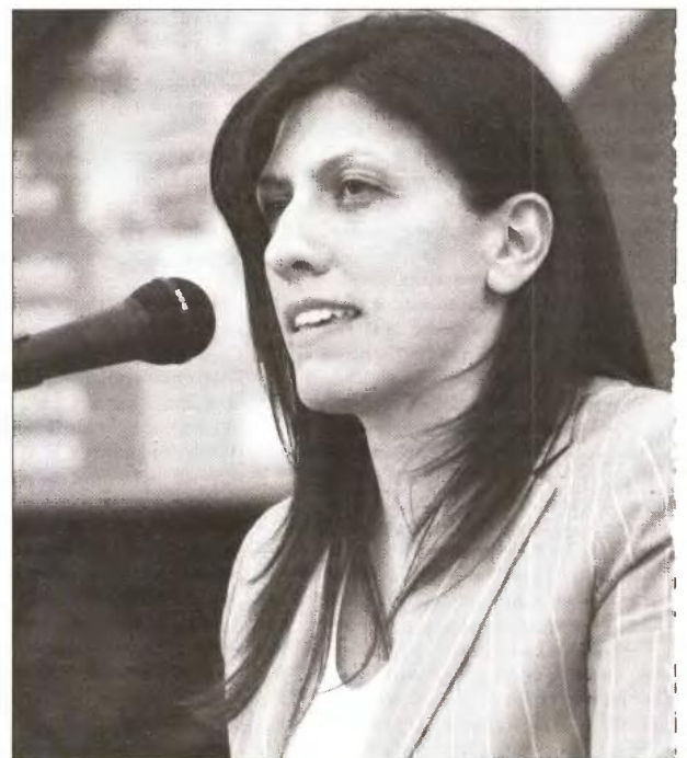
Η δικηγόρος Ζωή Κωνσταντοπούλου.

μα», είπε η κ. Κωνσταντοπούλου . Αναφερόμενη μάλιστα στην ουσία του νέου νόμου επισήμανε ότι «αυτό που κάνει είναι να αποτρέπει τον πολίτη από το να προσφύγει στη δικαιοσύνη. Η αύξηση των παραβόλων είναι απαγορευτική για την προσφυγή στη δικαιοσύνη, σε συνδυασμό με τις μειώσεις μισθών και την ανεργία σε δυσθεώρητα ποσά, που φτάνουν τα 300 ευρώ. Αυξάνει τα ποσά που αποτελούν αντικείμενο των κακουργημάτων, οδηγεί σε παραγραφή πολλών οικονομικών αδικημάτων και σ' αυτή ειδικά την εποχή μια τέτοια ρύθμιση είναι αναντίστοιχη και με τα δεδομένα τα κοινωνικά και τις επιταγές της κοινωνίας. Δεν είναι δυνατόν για πολύ υποδεέστερα αδικήματα ο απλός πολίτης να καθίσταται κατηγορούμενος και μάλιστα να απογυμνώνεται από δικαιώματα, αλλά οι πιο ισχυροί οικονομικά να απολαμβάνουν μιας ιδιαίτερης μεταχείρισης».