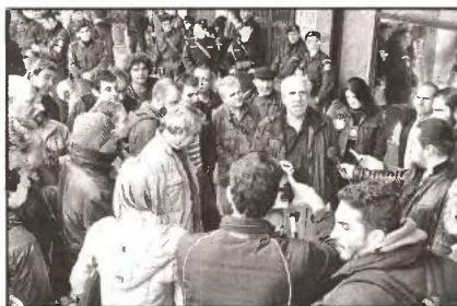
Τα ταξικά συνδικάτα αποκαλύπτουν εδώ και χρόνια τη διαρκή λεηλασία ΟΕΚ και ΟΕΕ (φωτ. από παλιότερη κινητοποίηση για τον ΟΕΚ)

Τ ην οριστική «ταφόπλακα» σε μια σειρά από παροχές που αφορούν το δικαίωμα στη στέγη, στον κοινωνικό τουρισμό και άλλα, επιχερούν να βάλουν συγκυβέρνηση και τρόικα, με το σχεδιαζόμενο κλείσιμο των Οργανισμών Εργατικής Κατοικίας (ΟΕΚ) και Εστίας (ΟΕΕ). Τα ενδεχόμενα λουκέτα στους δύο Οργανισμούς θα σημαίνουν το τέλος: • Του (ήδη κουτσουρεμένου) κατασκευαστικού προγράμματος του ΟΕΚ. • Της επιδότησης ενοικίου. • Των δανείων αποπεράτωσης και επισκευής που χορηγεί ο ΟΕΚ. • Της επιδότησης επιτοκίου για όσους έχουν πάρει δάνεια από τις τράπεζες. • Του κοινωνικού τουρισμού. • Των δελτίων θεάτρου και βιβλίων. • Των θερινών και χειμερινών εκδρομικών προγραμμάτων. Στις δαγκάνες των τραπεζών θα οδηγηθούν ολοκληρωτικά δεκάδες χιλιάδες δικαιούχοι του Οργανισμού Εργατικής Κατοικίας με ορατό πλέον τον κίνδυνο να χάσουν τα σπίτια τους (που ακόμα χρωστούν) αλλά και τα όποια χρήματα μέχρι σήμερα έχουν καταβάλει στις τράπεζες, σε ενδεχόμενο λουκέτο στον ΟΕΚ. Μέχρι σήμερα, ο ΟΕΚ, προκειμέ-