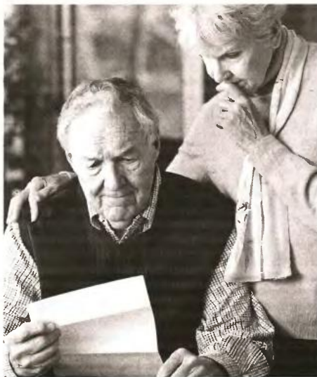
◀ ΣΤΑ ΣΕΝΑΡΙΑ που εξετάζονται είναι και η μείωση των συντάξεων για ποσά από 1.200 ευρώ και πάνω

Το θέμα του πλαφόν θα εξεταστεί και για τις οποίες περικοπές στα λεγόμενα «ευγενή» ταμεία. Στα σενάρια που έχουν μπει στο τραπέζι είναι οι μειώσεις να αφορούν ποσά άνω των 1.200 ευρώ.