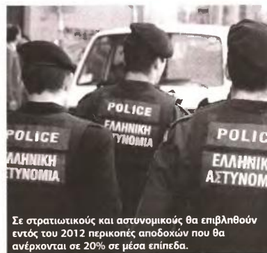
Σε στρατιωτικούς και αστυνομικούς θα επιβληθούν εντός του 2012 περικοπές αποδοχών που θα ανέρχονται σε 20% σε μέσα επίπεδα.

Περικοπές κοινωνικών παροχών για ανέργους, τριτέκνους, πολυτέκνους και αναπήρους