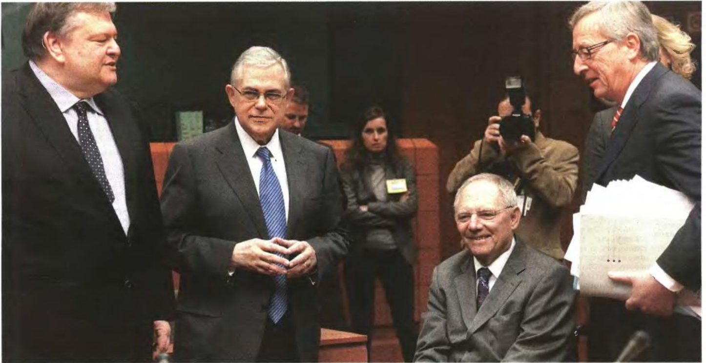
Χαμόγελα αλλά και σκεπτικισμός διακρίνεται στα πρόσωπα του υπουργού Οικονομικών Ευάγγελου Βενιζέλου, του Πρωθυπουργού Λουκά Παπαδήμου, του γερμανού υπουργού Οικονομικών Βόλφγκανγκ Σόιμπλε και του προέδρου του Eurogroup Ζαν-Κλοντ Γιούνκερ (από αριστερά προς τα δεξιά) λίγο προτού αρχίσουν οι μαραθώνιες διαπραγματεύσεις στις Βρυξέλλες