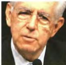
ΣΤΑΜΑΤΣ Β. 10. 38

Η Ευρώπη χρειάζεται ανάπτυξη αφού η γερμανική λιτότητα δεν αρκεί για να αντιμετωπιστεί η κρίση. Αυτό ζήτησαν με επιστολή τους προς την Κομισιόν δώδεκα ευρωπαίοι ηγέτες με πρωτεργάτη τον ιταλό Πρωθυπουργό Μάριο Μόντι (δεξιά).