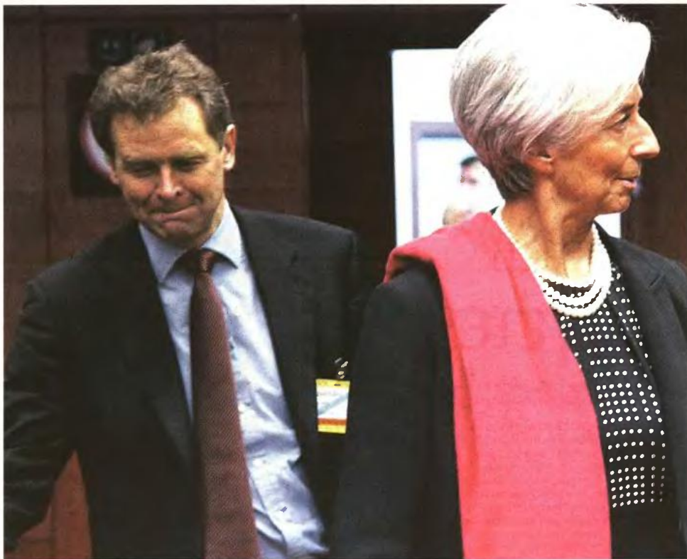
Στο Eurogroup, εκτός από την επικεφαλής του ΔΝΤ Κριστίν Λαγκάρντ, παρευρέθη και ο εκπρόσωπος του Ταμείου στην τρόικα Πολ Τόμσεν (αριστερά στη φωτογραφία). Η έκθεση της τρόικας για την Ελλάδα βρέθηκε στο επίκεντρο των συζητήσεων των υπουργών Οικονομικών της ευρωζώνης

Η έκθεση σημειώνει ότι, σε αντίθεση με όσα είχαν προβλεφθεί με βάση το πιο αισιόδοξο σενάριο, υπάρχει ο κίνδυνος να μην προχωρήσουν οι διαρθρωτικές μεταρρυθμίσεις, να μην ολοκληρωθεί η απελευθέρωση των αγορών προϊόντων και υπηρεσιών και να αποτύχουν οι μεταρρυθμίσεις στον επιχειρηματικό κλάδο λόγω γραφειοκρατικών καθυστερήσεων.