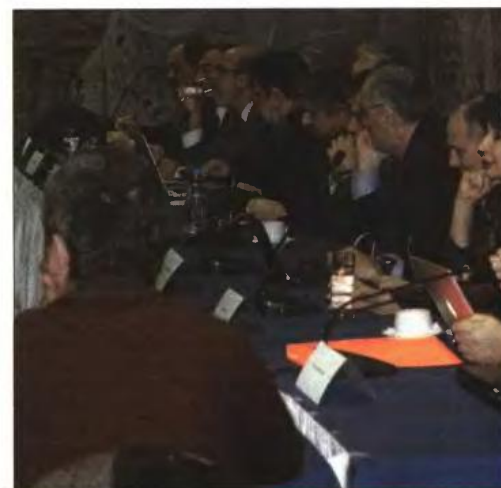
▲ Από τη χθεσινή συνεδρίαση των πρυτάνεων στο Λαύριο