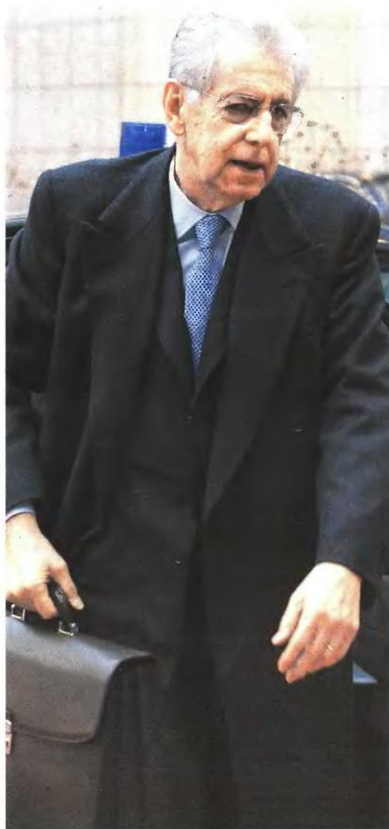
Ο παλός Πρωθυπουργός Μάριο Μόντι ενώ προσέρχεται στη συνεδρίαση του Eurogroup. Ήταν ο πρώτος που ανακοίνωσε την ύπαρξη της επιστολής των 12 ηγετών της ΕΕ που ζητούν να ληφθούν μέτρα για την ανάπτυξη

«Καθένας από εμάς αναγνωρίζει ότι το σχέδιο που προτείνουμε απαι-