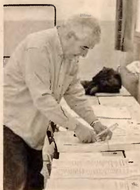
Δραστική περικοπή του εκλογικού επιδόματος, το οποίο δεν θα υπερβαίνει τα 500 ευρώ.

Στο μεταξύ, τη δραστική περικοπή του εκλογικού επιδόματος, το οποίο δεν θα υπερβαίνει τα 500 ευρώ, και περικοπές δαπανών ύψους 1,186 δισ. ευρώ για διάφορες δαπάνες των υπου-