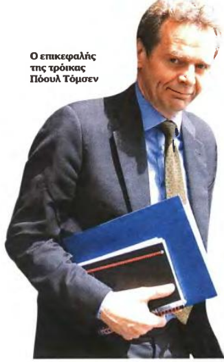
Ο επικεφαλής της τρόικας Πόουλ Τόμσεν

τα στοιχεία, η συνολική δαπάνη για φάρμακα έπρεπε να έχει μειωθεί από 4,2 δισ. ευρώ ετησίως στα 2,9 δισ. ευρώ, δηλαδή να είναι οικονομικότερη 1,2-1,3 δισ. ευρώ, και το ποσό που εξακολουθούσε να είναι 200-300 εκατ. ευρώ, και αυτό από τα νοσοκομεία. «Δεν μπορούν οι γιατροί να συνταγογραφήσουν τα ακριβά φάρμακα όταν υπάρχουν τα φθηνότερα, όπως γίνεται σε όλες τις ευρωπαϊκές χώρες» σημείωσαν και παρατήρησαν ότι, ενώ τα νοσοκομεία χρησιμοποιούν πλέον σε ποσοστό 25% γενόσημα, το αντίστοιχο ποσοστό στις συνταγογραφίες μικρών ταμείων και ιδιωτών γιατρών δεν ξεπερνά το 18%. «The money is over, the party is over» είπαν στην ελληνική αντιπροσωπεία θυμίζοντας: «Ανδ' έχετε πια τα χρήματα για να αγοράσετε ακριβά φάρμακα. Οι ασθενείς να πληρώνουν μόνοι τους αν θέλουν τα ακριβά φάρμακα».