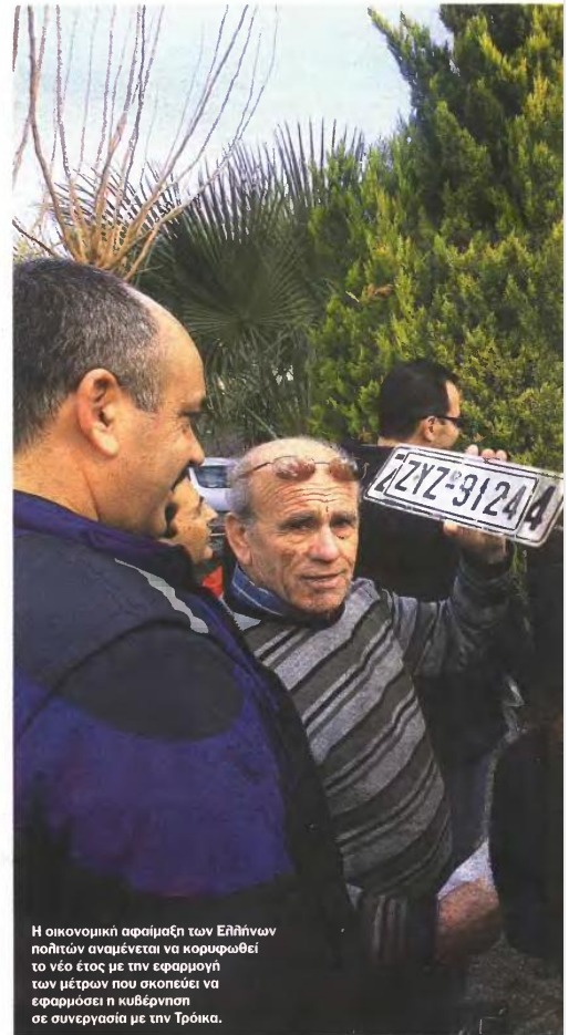
Η οικονομική αφαιμάξη των Ελλήνων πολιτών αναμένεται να κορυφωθεί το νέο έτος με την εφαρμογή των μέτρων που σκοπεύει να εφαρμόσει η κυβέρνηση σε συνεργασία με την Τρόικα.

6 Επιβολή αντικειμενικών κριτηρίων για τη φορολόγηση των μικρομεσαίων επιχειρήσεων και των ελεύθερων επαγγελματιών. Επιδιώκεται να εφαρμοστούν «αντικειμενικά κριτήρια προσδιορισμού ελαχίστων ορίων φορολογητέου εισοδήματος» για όλες τις ατομικές εμπορικές επιχειρήσεις, τις ατομικές επιχειρήσεις παροχής υπηρεσιών και τους ελεύθερους επαγγελματίες. Τέτοια κριτήρια θα είναι, για παράδειγμα, το πραγματικά καταβαλλόμενο ή το τεκμαίριο ενόικιο της επαγγελματικής στέγης ή η λεγόμενη μισθωτική αξία της επαγγελματικής εγκατάστασης, τα ελάχιστα όρια αμοιβών των μισθωτών απασχολούμενων σε μικρομεσαίες επιχειρήσεις κ.λπ. Επιπλέον, το ύψος του ελάχιστου ορίου εισοδήματος θα προσαρμόζεται περαιτέρω, με κριτήρια την εμπλοκότητα της περιοχής στην οποία ασκείται η επαγγελματική δραστηριότητα, καθώς και με βάση τα επίπεδα άσκησης και το είδος της δραστηριότητας. Εφόσον το δηλώσουν, βάσει λογιστικού προσδιορισμού, εισοδήμα του επιτηδεύματός είναι