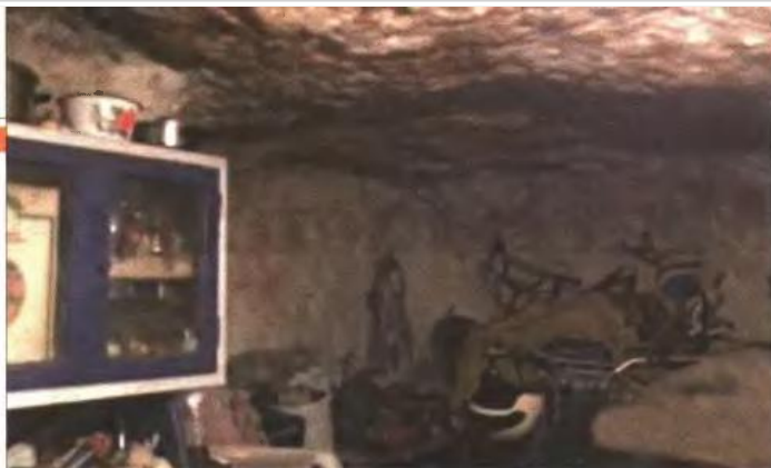
▲ Εικόνες από τις άθλιες συνθήκες διαβίωσης της πενταμελούς οικογένειας σε σπηλιά