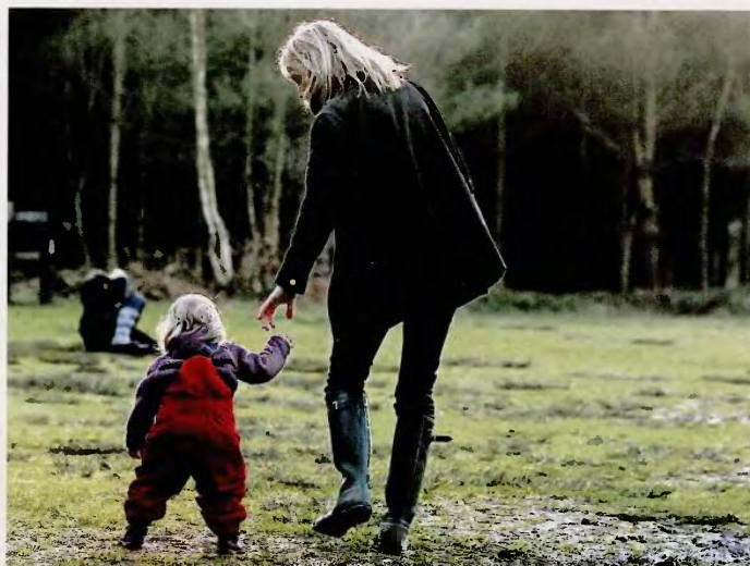
Όλο και περισσότερα παιδιά έχουν την ανάγκη φιλοξενίας, προστασίας και κυρίως αγάπης. Οι ανάδοχοι γονείς αναλαμβάνουν παιδιά που διαφορετικά θα κατέληγαν σε ιδρύματα, ωστόσο η επιμέλειά τους παραμένει στο κράτος.