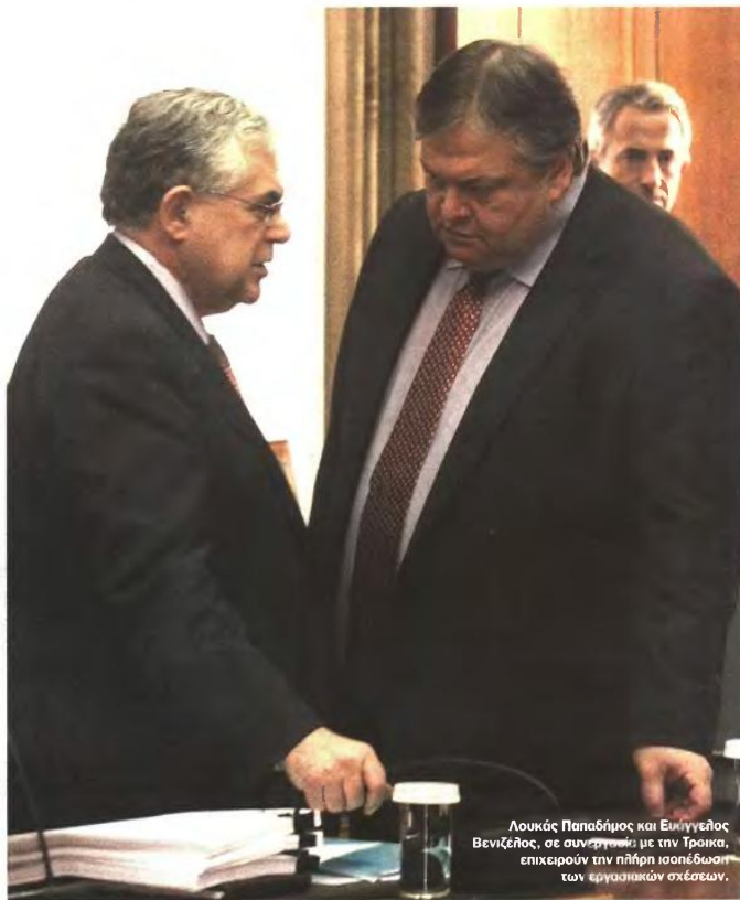
Λουκάς Παπαδήμος και Ευάγγελος Βενιζέλος, σε συνάντηση με την Τρόικα, επικεφαλής την πλήρη ισοδύναση των εργασιακών σχέσεων.

Αυτή η... εξομίσωση του ιδιωτικού με το δημόσιο τομέα όσον αφορά στο νομοθετικό καθεστώς καταβολής των επιδομάτων Εορτών και αδειάς φαίνεται ότι κρύβεται πίσω από τα όσα ανέφερε την περασμένη Παρασκευή στη Βουλή ο πρω-