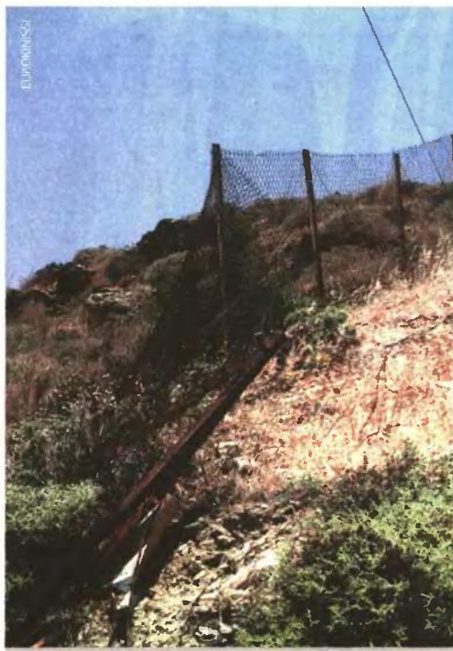
Βασική προϋπόθεση για τη νομιμοποίηση της αυθαίρετης κατοχής με εξαγορά είναι η καταπάτηση να έχει γίνει τουλάχιστον πριν από 25 χρόνια και να συνεχίζεται μέχρι σήμερα.

ΓΙΩΡΓΟΣ ΠΑΛΑΙΤΣΑΚΗΣ gpalaitisakis@e-typos.com