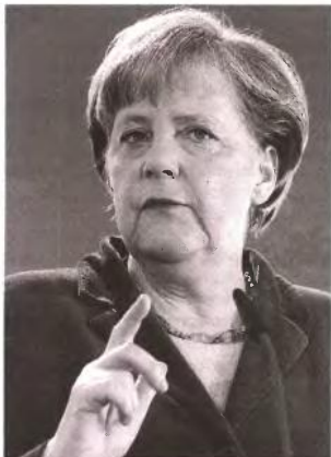
Προβλήματα στο φοροεπισκευαστικό σύστημα εντόπισε η Ανγκελα Μέρκελ.

« ΣΥΝΕΧΙΣΤΕ ΤΗ ΛΙΤΟΤΗΤΑ και... κάποτε θα δείτε φως», ήταν το ξεκάθαρο μήνυμα που έστειλε στην Ελλάδα η Ανγκελα Μέρκελ, σε κλειστή της συνέντευξη στο γερμανικό ραδιόφωνο. Η καγκελάρια δεν δίστασε να ομολογήσει πως οι περικοπές δαπανών οδηγούν σε ύφεση την ελληνική οικονομία. Επικαλέστηκε ως τόσσο «πολλά παραδείγματα χωρών που υλοποίησαν προγράμματα του ΔΝΤ και στη συνέχεια βγήκαν από την ύφεση περνώντας σε φάση ανάπτυξης».