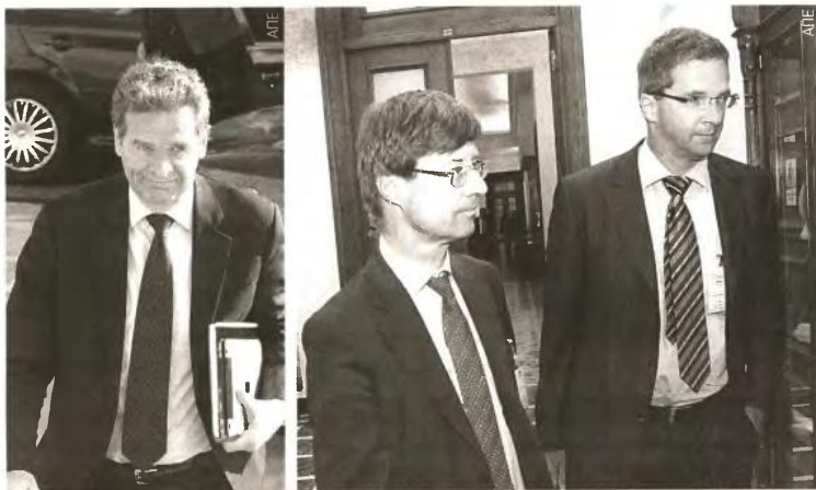
Εντός της εβδομάδας καταφάνουν στην Αθήνα οι επικεφαλής του κλιμακίου της Τρόικας κύριοι Τόμισεν (ΔΝΤ), Μορς (Ε.Ε.) και Μαζούκ (ΕΚΤ).

βάνει αποδοχές 450 ευρώ το μήνα, τότε το ... Δύο των Χριστουγέννων θα ανέρχεται σε 450 ευρώ, το Δώρο Πάσχα σε 225 ευρώ και το επίδομα αδείας σε 225 ευρώ. Για τους «μηνιόμισθους» εργαζομένους, δηλαδή γι' αυτούς οι οποίοι θα λαμβάνουν μηνιαίες αποδοχές πάνω από το όριο που θα καθοριστεί, ο 13ος και ο 14ος μισθός θα καταργηθούν πλήρως! 2 Το «πάγωμα» των αποδοχών των εργαζομένων στον ιδιωτικό τομέα για τουλάχιστον τέσσερα χρόνια, δηλαδή μέχρι το τέλος του 2015, με κατάργηση της ισχύουσας Εθνικής Γενικής Συλλογικής Σύμβασης Εργασίας που προβλέπει για φέτος αύξησης μισθών! 3 Απολύσεις εκατοντάδων χιλιάδων δημοσίων υπαλλήλων ώστε ο αριθμός των εργαζομένων στις υπηρεσίες, στους φορείς και τους οργανισμούς του κράτους να μειωθεί φέτος κατά 50.000 - 100.000 άτομα και ομοίως μέχρι το τέλος του 2015 τουλάχιστον κατά 200.000-300.000 άτομα! 4 Νέες μειώσεις μισθών. Στους στρατιωτικούς, στους αστυνομικούς, στους λιμενικούς, στους πυροσβέστες, στους δικαστικούς, στους ιατρούς του ΕΣΥ, στους πανεπιστημιακούς καθηγητές, στους καθηγητές ΤΕΙ, στους ερευνητές, στους διπλωματικούς υπαλλήλους και τους λοιπούς λειτουργούς του Δημοσίου, οι οποίοι εξαιρέθηκαν από το επαχθές μισθολόγιο των πολιτικών υπαλλήλων, θα επιβληθούν εντός του 2012 περικοπές αποδοχών που θα ανέρχονται σε