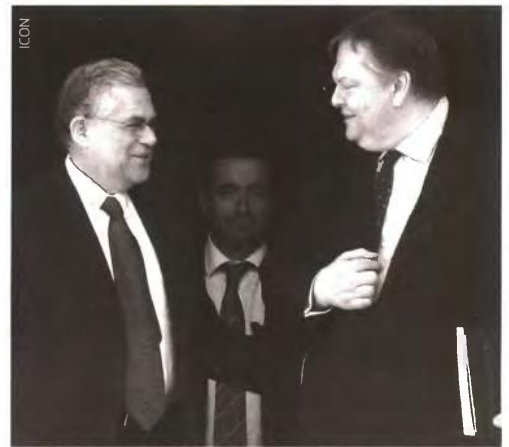
Ο πρωθυπουργός Λουκάς Παπαδήμος και ο υπουργός Οικονομικών Ευάγγελος Βενιζέλος έχουν ήδη συμφωνήσει με την Τρόικα.

Οι τρικοίνοι θα παρουσιάσουν το επιχειρημα ότι εξαιτίας των σημαντικών αναβολών και καθυστέρησεων στην υλοποίηση όλων αυτών των αλλαγών, η ελληνική οικονομία δεν ανακάμπτει και το χρονοδιάγραμμα δημοσιονομικής προσαρμογής και διαρθρωτικών αλλαγών, όπως είχε συμφωνηθεί μέχρι τώρα, ανατρέπεται! Αυτές οι «πρόσθετες» παρεμβάσεις, που θα παρουσιαστούν ως αναγκαίες να επιβληθούν για να ανακάμψει η ελληνική οικονομία, θα προβλέ-