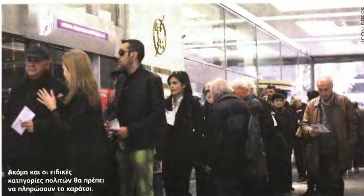
Ακόμα και οι ειδικές κατηγορίες πολιτών θα πρέπει να πληρώσουν το χαράτσι.

1 ΑΝΤΙΜΕΤΩΠΙΣΗ περιπτώσεων αναπήρων και βαριά ασθενών πολιτών: Η ισχύουσα νομοθετική ρύθμιση για το Ειδικό Τέλος Ηλεκτροδοτούμενων Κτισμάτων προβλέπει σημαντική μειωμένη επιβάρυνση της τάξεως του 0,5 ευρώ ανά τετραγωνικό μέτρο μόνο για τους ολικώς τυφλούς και τους έχοντες βαριές κινητικές αναπηρίες σε ποσοστό μεγαλύτερο του 80%, οι οποίοι ιδιοκατοικούν στα ηλεκτροδοτούμενα ακίνητα, υπό τις προϋποθέσεις ότι σε κάθε περίπτωση: α) Το ακίνητο ανήκει στο φορολογούμενο κατά πλήρη κυριότητα ή επικαρπία. β) Η αξία της ακίνητης περιουσίας του δικαιούχου ήταν την 1η-1-2008 μικρότερη του ορίου τους 150.000 ευρώ, το οποίο προσαρτάται κατά 10.000 για κάθε