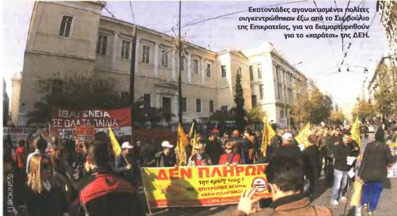
Εκατοντάδες αγανακτισμένοι πολίτες συγκεντρώθηκαν έξω από το Συμβούλιο της Επικρατείας, για να διαμαρτυρηθούν για το «χαράτσι» της ΔΕΗ.