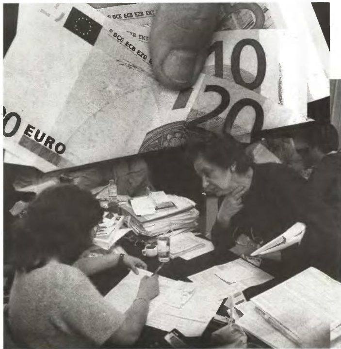
Η κατάργηση των φοροαπαλλαγών σε συνδυασμό με τη μείωση του αφορολόγητου ορίου μετατρέπουν ακόμη και τους χαμηλόμισθους και χαμηλοσυνταξιούχους σε χρεωστικούς, οπότε, πρέπει να ξεχάσουν μια για πάντα τα χαρτάκια της επιστροφής φόρου.

► Ευνοϊκές φορολογικές ρυθμίσεις για αγρότες, επιχειρήσεις, νομικά πρόσωπα μη κερδοσκοπικού χαρακτήρα κ.ά.