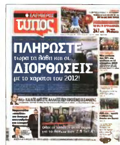
Επιβεβαιώθηκε το ρεπορτάζ του «Ε.Τ.» που ανέφερε ότι οι πληρωμές θα γίνουν κανονικά, ενώ οι διορθώσεις θα αργήσουν...

Με την ίδια εγκύκλιο: ▶ Αυξάνεται από 40 σε 80 ημέρες το χρονικό διάστημα που απαιτείται να παραμείνει απλήρωτο το χαράτσι, ώστε να δοθεί εντολή διακοπής της ηλεκτροδότησης! ▶ Ρυθμίζονται με κάθε λεπτομέρεια οι διαδικασίες με τις οποίες θα γίνουν οι διορθώσεις στα λανθασμένα στοιχεία υπολογισμού του ειδικού τέλους που αναγράφονται στους λογαριασμούς της ΔΕΗ. ▶ Προαναγγέλλεται ότι θα νομο-