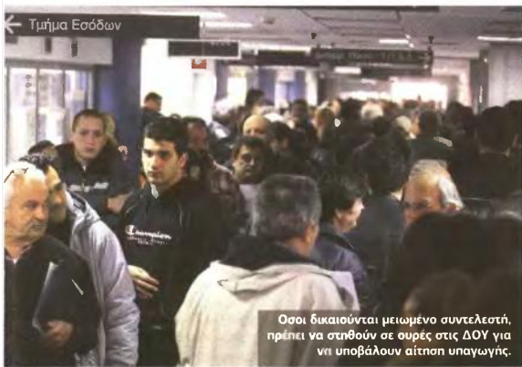
Όσοι δικαιούνται μειωμένο συντελεστή, πρέπει να σπεύδουν σε ουρές στις ΔΟΥ για να υποβάλουν αίτηση υπαγωγής.

ηλεκτρικού ρεύματος, είτε επισημασμένοι με μηχανογραφική ένδειξη ότι η οφειλή εξοφλήθηκε είτε συνοδευόμενοι με οποιοδήποτε αποδεικτικό εξόφλησης.