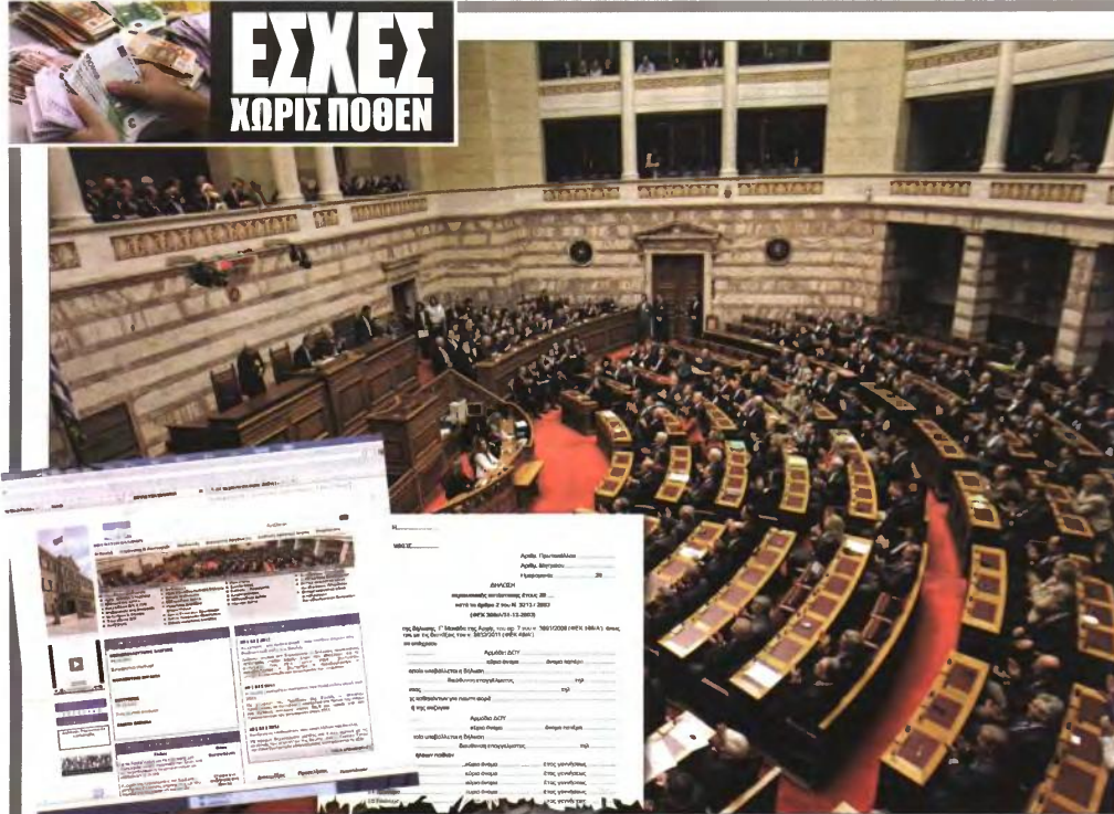
▲ Η Ολομέλεια της Βουλής. Αριστερά: Η ιστοσελίδα του Κονοβουλίου και, δεξιά, η πρώτη σελίδα δήλωσης «πόθεν έσχες»