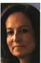
▲ Από πάνω: Ευ. Βενιζέλος, Θ. Πάγκαλος, Β. Αποστολάτος, Α. Λοβέρδος, Δ. Κρεμασιάνος, Α. Διαμαντοπούλου