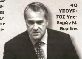
«Ο ΥΠΟΥΡΓΟΣ Υποδομών Μ. Βορίδης