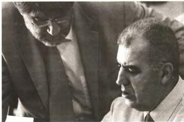
«Ο ΥΠΟΥΡΓΟΣ Διοικητικής Μεταρρύθμισης Δ. Ρέππας και ο υφυπουργός Ντ. Ρόβλιος, ο οποίος υπογράφει την εγκύκλιο

5 Οι προστάτες μονογονεϊκών οικογενειών πρέπει να καταθέσουν πιστοποιητικό οικογενειακής κατάστασης, υπεύθυνη δήλωση του υπαλλήλου ότι είναι προστάτης μονογονεϊκής οικογένειας και σε περίπτωση διάστασης ή διαζυγίου, δικαστική απόφαση από την οποία να προκύπτει η αποκλειστική ανάθεση στις γονικές μέριμνες. Επίσης ακριβές αντίγραφο της δήλωσης φορολογίας εισοδήματος.