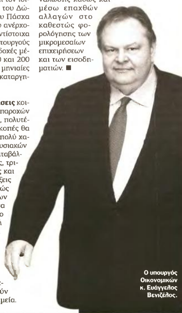
Ο υπουργός Οικονομικών κ. Ευάγγελος Βενιζέλος.

8 Μειώσεις στα ποσά των δαπανών υγειονομικής περίθαλψης που θα μπορούν να καλύψουν τα ασφαλιστικά ταμεία.