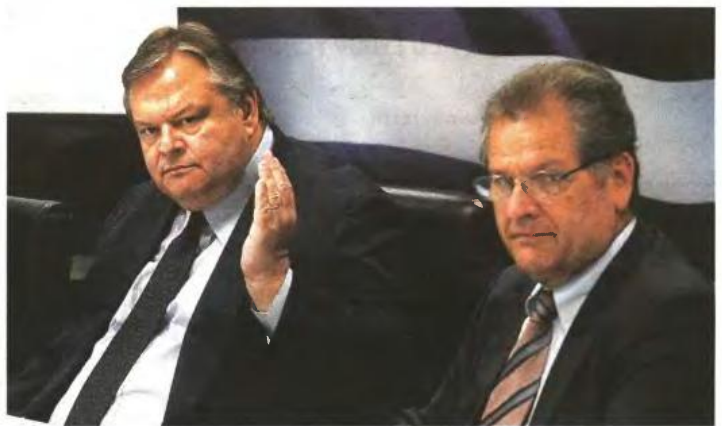
Ο υπουργός Οικονομικών κ. Ευ. Βενιζέλος (αριστερά) και ο αναπληρωτής υπουργός Οικονομικών κ. Π. Οικονόμου έχουν στα χέρια τους προτάσεις οι οποίες αναφέρουν ότι μπορεί το Εκτακτο Ειδικό Τέλος Ηλεκτροδοτούμενων Δομημένων Επιφανειών (ΕΕΤΗΔΕ) εφεξής να υποκαταστήσει κάθε άλλη επιβάρυνση επί ακινήτου

Αλλωστε και στον προϋπολογισμό υπάρχει αναφορά για μείωση των «αφορολογητών» στα ακίνητα και