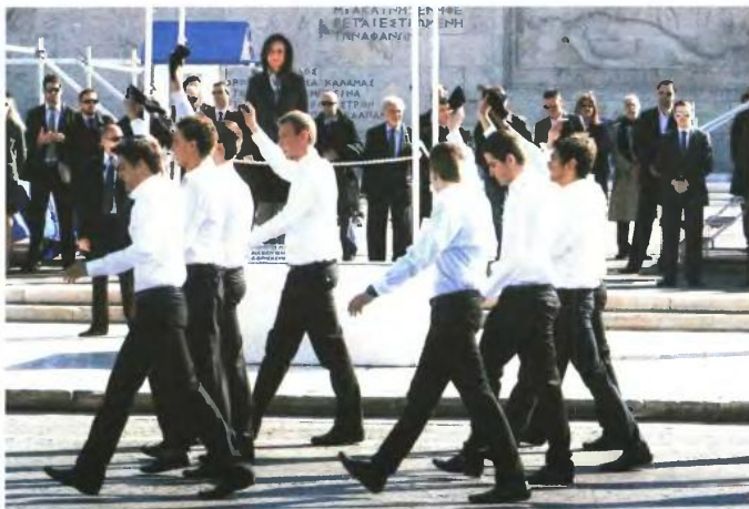
Η συντριπτική πλειονότητα των μαθητών σε όλη την Ελλάδα θεωρεί δικαιολογημένες τις αντιδράσεις απέναντι στους πολιτικούς κατά τη διάρκεια της παρέλασης.

«Οι μαύρες κορδέλες ήταν δείγμα αγανάκτησης της σημερινής νεολαίας. Δεν χρειαζόμαστε καθοδηγητές. Ήταν αποκλειστικά πρωτοβουλία των μαθητών και δεν φέρει ευθύνη κανένας ανώτερος. Αυτά που έγιναν στις παρελά-