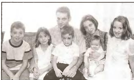
Είναι συμφέρον του λαού και της φτωχής πολύτεκνης οικογένειας ένα πανίσχυρο λαϊκό κίνημα, στηριγμένο στην κοινωνική συμμαχία της εργατικής τάξης, των αυτοαπασχολούμενων, των μικροεργαζομένων, της νεολαίας και των γυναικών των λαϊκών οικογενειών, όλων αυτών που συνθλίβονται από τα μονοπώλια

Αυτή η πολιτική έχει τη στήριξη και των άλλων κομμάτων του κεφαλαίου, της ΝΔ, του ΛΑ.Ο.Σ. και του κόμματος της Δημοκρατικής Συμμάχιας. Με τη λεγόμενη "εθνική συνεννόηση" και με τις αντιπαραθέσεις τους παραπλανούν το λαό, προσπαθούν να τον εγκλωβίσουν σε νέες πιο επώδυνες θύσεις. Είναι πολιτικές δυνάμεις που εχθρεύονται και συκοφαντούν κάθε λαϊκή αντίσταση και διεκδίκηση, έχουν στηρίξει κάποιους και με τη ψήφο τους στη Βουλή το σύνολο των αντιλαϊκών μέτρων.