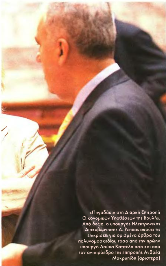
«Πηγαδάκι» στη Διαρκή Επιτροπή Οικονομικών Υποθέσεων της Βουλής. Από δεξιά, ο υπουργός Ηλεκτρονικής Διακυβέρνησης Δ. Ρέππας ακούει τις επικρίσεις για ορισμένα άρθρα του πολυνομοσχεδίου τόσο από τον πρώην υπουργό Λούκα Κατσέλη όσο και από τον αντιπρόεδρο της επιτροπής Ανδρέα Μακρυπιδή (αριστερά)