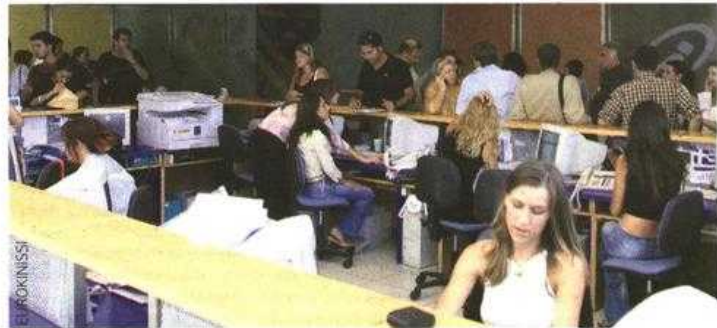
Η ωρίμανση των αποδοχών στο Δημόσιο θα γίνεται με πιο αργούς ρυθμούς καθώς θα αυξηθεί στα 3 ή στα 4 έτη.

την καταβολή επιδομάτων ή άλλων εισοδηματικών ενισχύσεων κοινωνικού χαρακτήρα. Αυτό σημαίνει, για παράδειγμα, ότι ένας πολύτεκνος μισθωτός, ο οποίος εισπράττει από τον εργοδότη του επίδομα οικογενειακών βαρών προδιορισμένο με βάση τον αριθμό των παιδιών που τον βαρύνουν, θα δικαιούται μειωμένο πολύτεκνικό επίδομα ή δεν θα εισπράττει καθόλου επίδομα. Η σύσταση ενιαίου φορέα για την άσκηση κοινωνικής πολιτικής, που, όπως τόνισε ο πρωθυπουργός, «θα μπορεί να καταγράψει, να παρακολουθεί και να αξιολογεί τις παροχές», σημαίνει ότι ο καθορισμός των δικαιούχων εισπράττει κοινωνικών επιδομάτων και παρο-