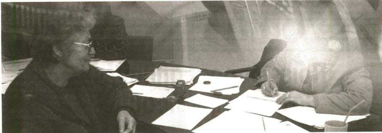
Στην κυβερνητική παράταξη υπάρχει αγώνια για την ομαλή αποδοχή του μεσοπρόθεσμου προγράμματος, αλλά και των πρόσθετων μέτρων που πρέπει να ληφθούν ως το τέλος του έτους εξαιτίας της ανασθεώρησης του ελλείμματος.