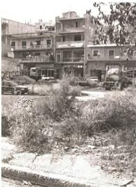
Εσχάστηκε το «φτωκό Κερατσίνι του μισού ευρώ»

Ο συντελεστής παλαιότη- ο, όπως έχει οριστεί από την ορία, κυμαίνεται από 0,90 ικτιόματα 1-5 ετών, 0,80, για 0, ο,75 για 11-15, 0,70 για 16- ο, 0,65 για 21-25 και 0,60 για ο των 25 ετών.