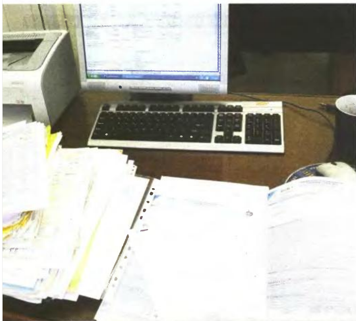
Αλλάζουν τα δεδομένα για τις φορολογικές δηλώσεις του 2012.