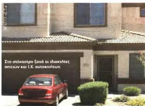
Στο στάθρα ξανά οι ιδιοκτήτες σπιτιών και Ι.Χ. αυτοκινήτων.

2 Ο τρόπος υπολογισμού του ποσού των αποδείξεων που πρέπει να συγκεντρώνει κάθε φορολογούμενος αλλάζει για τα εισοδήματα που αποκτώνται φέτος και θα φορολογηθούν το 2012. Κατ' αρχήν αποδείξεις πρέπει να μαζεύει πλέον κάθε φορολογούμενος, ακόμη κι αν το συνολικό ατομικό εισόδημά του είναι χαμηλότερο των 6.000 ευρώ! Για πρώτη φορά δηλαδή καλούνται πλέον να μαζεύουν αποδείξεις ακόμη και οι χαμηλοσυνταξιούχοι του ΟΓΑ, διότι αν δεν το πράξουν κινδυνεύουν να φορολογηθούν! Από και πέρα για να κατοχυρώσει ως αφορολόγητες τις πρώτες 8.000 ευρώ του εισοδήματός του, ο κάθε φορολογούμενος θα πρέπει να συγκεντρώσει αποδείξεις αξίας ίσης με το 25% του ετησίου