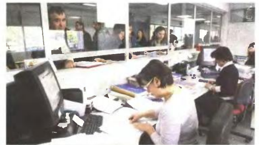
«Θαμώνες» των εφοριών θα γίνουν οι Έλληνες φορολογούμενοι.

Για τον υπολογισμό της εισφοράς θα εκδοθούν εκκαθαριστικά σημειώματα τα οποία θα αποσταλούν στους υπόχρεους. ■