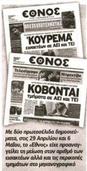
Με δύο πρωτοσέλιδα δημοσιεύματα, στις 29 Απριλίου και 6 Μαΐου, το «Εθνος» είχε προαναγγείλει τη μείωση στον αριθμό των εισακτέων αλλά και τις περικοπές τμημάτων στο μηχανογραφικό