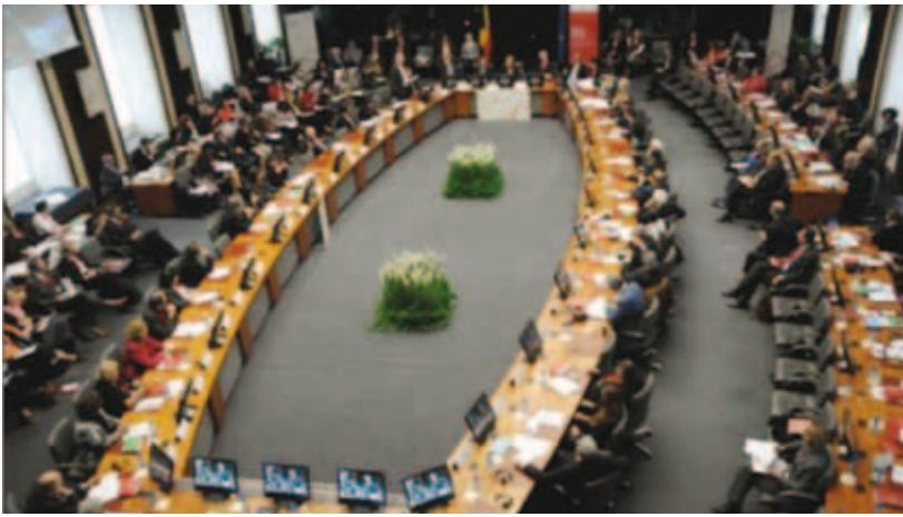
Αποψη της αίθουσας κατά τη διάρκεια συνεδρίασης.