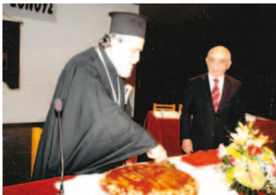
Ο Μητροπολίτης Φιλίππων, Νεαπόλεως και Θάσου κ.κ. Προκόπος στην κοπή της πίτας μαζί με τον Πρόεδρο κ. Βοϊδη.