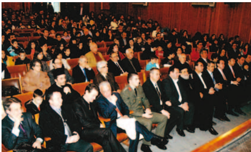
Κοπή βασιλόπιτας του Συλλόγου Πολυτέκνων Ν. Καβάλας στις 23-1-2011.