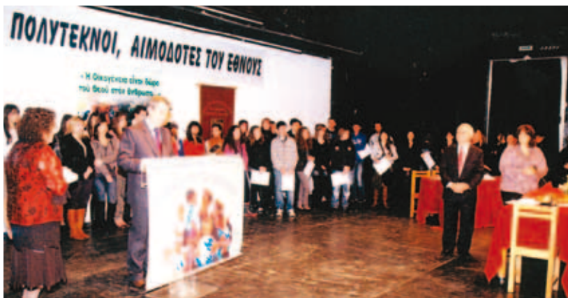
Κοπή βασιλόπιτας του Συλλόγου Πολυτέκνων Ν. Καβάλας στις 23-1-2011. Οι επιτυχόντες Α.Ε.Ι., Τ.Ε.Ι. Στρατιωτικές Αστυνομικές Σχολές και οι αριστεύσαντες Γυμνασίου και Λυκείου σε επίπεδο Νομού ήταν 136.