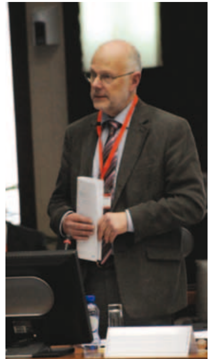
Ο Πρόεδρος της Ευρωπαϊκής Οικονομικής και Κοινωνικής Επιτροπής κος Στάφαν Νίλσον

έχοντες ανάγκη βοήθειας, ώστε να διατηρείται ένα επίπεδο ζωής τουλάχιστον ικανοποιητικό για όλα τα εξαρτώμενα μέλη και τις οικογένειες τους.