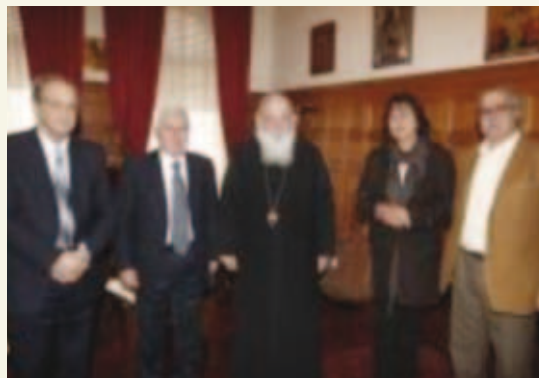
Ο Αρχιεπίσκοπος και μέλη της Εκτελεστικής Επιτροπής