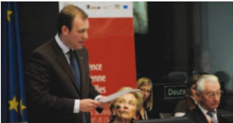
Ο Βέλγος υπουργός αρμόδιος για θέματα οικογενειών ομιλεί.