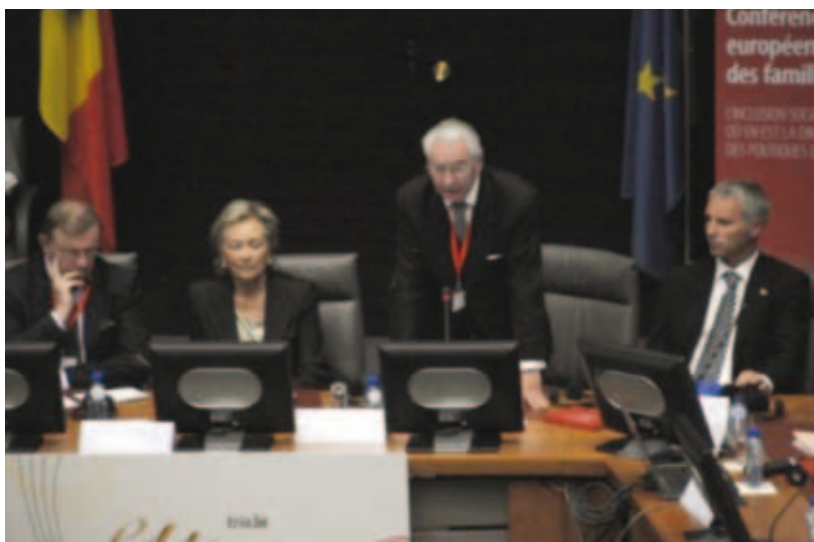
Στο Κέντρο η Βασίλισσα του Βελγίου Πάολα που τιμητικά προήδρευσε στην 1η συνεδρία. Δεξιά της όρθιος ο Πρόεδρος της COFACE κος Γκοσλάν και δεξιά του ο Ούγγρος Υπουργός αρμόδιος για θέματα οικογενειών.

Κοινοβουλίου, Γαλλίδα ευρωβουλευτής κα Λαστέξ, επισήμανε ότι η απόφαση για απόκτηση παιδιών πρακτικά σημαίνει εμπιστοσύνη στο μέλλον. Όταν δεν υπάρχει αυτή λόγω ανεργίας, περικοπών στις κοινω-