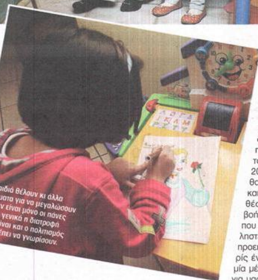
Το παιδί θέλουν κι άλλα πράγματα για να μεγαλώσουν και δεν είναι μόνο οι πάνες τους ή γενικά η διατροφή τους, είναι και ο παλιμοτός που πρέπει να γνωρίζουν.