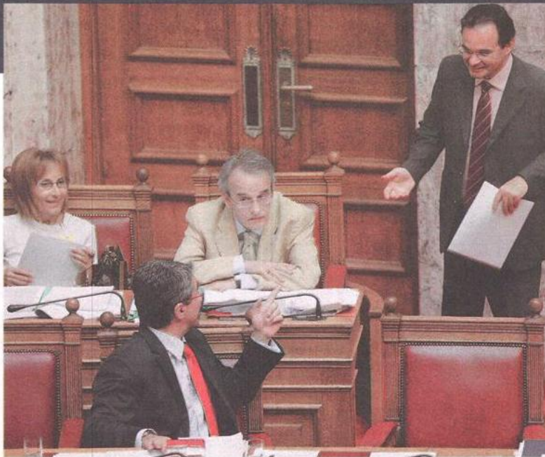
«Δεν μου ζήτησε κανένα μέτρο ο Παπακωνσταντίνου» λέει για τον υπουργό Οικονομικών ο κ. Ανδρέας Λοβέρδος