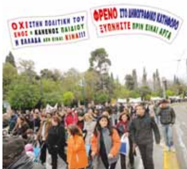
Από την πορεία διαμαρτυρίας μας στην Αθήνα.

ΑΠΟ ΤΗΝ ΠΟΡΕΙΑ ΠΡΟΣ ΤΗ ΒΟΝΑΗ ΣΤΙΣ 15/12/2010 ΜΕΤΑ ΤΗ ΣΥΓΚΕΝΤΡΩΣΗ ΔΙΑΜΑΡΤΥΡΙΑΣ ΣΤΟ ΖΑΠΕΙΔ