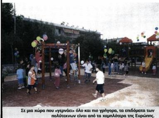
Σε μια χώρα που «γεννάει» όλο και πιο γρήγορα, τα επιδόματα των πολύτεκνων είναι από τα χαμηλότερα της Ευρώπης.

Εξκινάει το διάβασμα, το μαγείρεμα, το σιδερώμα και όλες οι υπόλοιπες δουλειές του σπιτιού» λέει στον «Ε.Τ.» και συμπληρώνει: «Η πολύτεκνη μητέρα δεν έχει πολύ χρόνο για τον εαυτό της. Δεν είναι εύκολο να υπάρχει κάποια