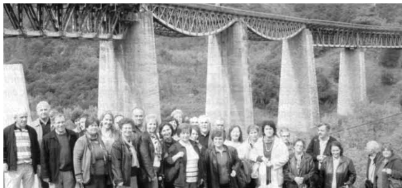
Οι εκδρομείς μπροστά στο σύμβολο της Ενωμένης Εθνικής Αντίστασης.