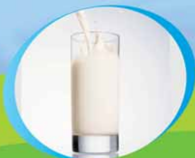
υπέροχο πλούσιο γάλα