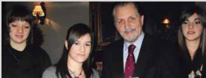
Βράβευση μαθητών από το Νομάρχη Λάρισας Λουκά Κατσαρό.