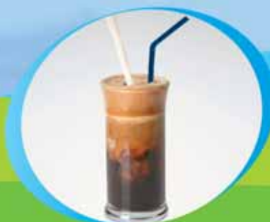
για απολαυστικό καφέ