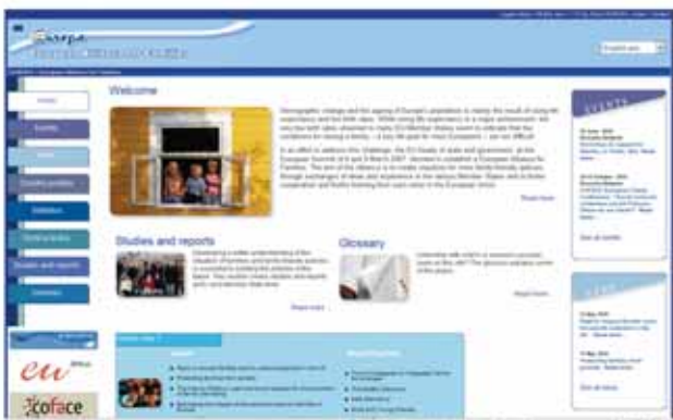
Η διαδικτυακή πύλη της Ευρωπαϊκής Συμμαχίας για την Οικογένεια

http://ec.europa.eu/employment_social/emplweb/families/index.cfm