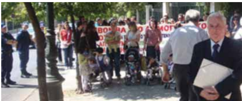
Το προεδρείο της ΑΣΠΕ επικεφαλής της πορείας των αδιόριστων εκπαιδευτικών απέναντι από το Μέγαρο Μαξίμου.