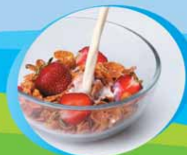
για γευστικό πρωινό