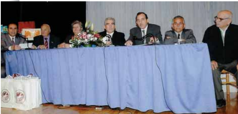
Ο Πρόεδρος και μέλη του ΔΣ του Συλλόγου Πολυτέκνων Λαρίσης και περιχώρων

Στην εκδήλωση παρέστησαν μεταξύ άλλων οι Βουλευτές κ. Β. Έξαρχος και Α. Ροντούλης, Νομαρχιακοί και Δημοτικοί Σύμβουλοι, αντινομάρχες και αντιδήμαρχοι, ενώ τηλεγραφήματα απέστειλαν ο Υφυπουργός Οικονομικών κ. Φιλ. Σαχινίδης, η Υφυπουργός Τουρισμού και Πολιτισμού κα Α. Γκερέκου και οι Βουλευτές κ. Χρ. Ζώης και Μ. Χαρακόπουλος.