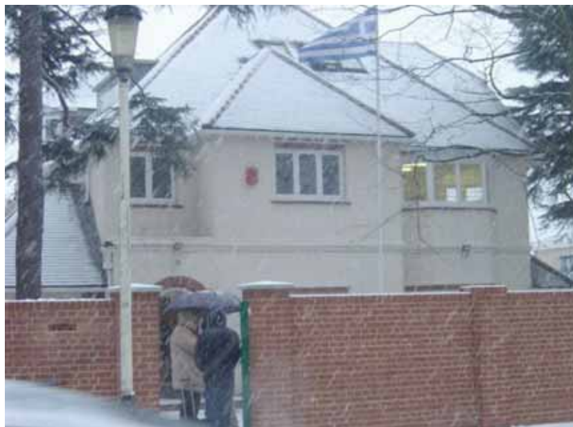
Το Ελληνικό Δημοτικό Σχολείο Λονδίνου

Δ.Χ.: Θα πρέπει την 1η Σεπτεμβρίου να παρουσιαστεί στην Πρεσβεία, όπου θα αναλάβει υπηρεσία και θα τοποθετηθεί σε σχολεία. Επειδή στο