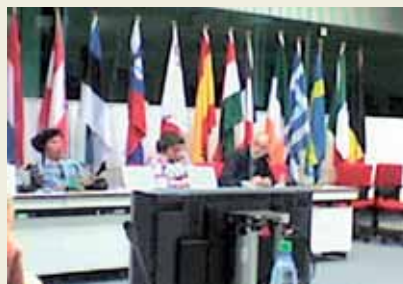
Φωτογραφίες από την τελευταία Γενική Συνέλευση, Ιούνιος 2008.