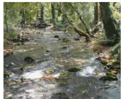
Ομορφιές του όρους Αγγίτη

τοπικών ΜΜΕ: Ελεύθερο Βήμα των Σερρών, Εβδόμη και Ηχώ Δράμας. Ακόμη σχετικό υλικό είχαν οι ηλεκτρονικές διευθύνσεις: Isotimia.gr, alfavita.gr, Ο Χρόνος, Kavala Net κ.λπ. Αξίζει να σημειωθεί ότι πριν το Συνέδριο, η ΑΣΠΕ είχε πραγματοποιήσει διαφημιστικές καταχωρήσεις με την αφίσσα του Συνεδρίου στις εφημερίδες: City Press, Metro & Metropolis. Στα συμπεράσματα του συνεδρίου καταγράφηκε η απαίτηση των πολύτεκνων οικογενειών για υψηλότερου επιπέδου Δημόσια δωρεάν Παιδεία, συμβολή όλων των σχετικών φορέων στη καλύτερη διαπαιδαγώγηση των παιδιών μας και δωρεάν επιμόρφωση των γονέων σε συγκεκριμένα θέματα όπως: προστασία των παιδιών κατά τη χρήση του διαδικτύου, ανάπτυξη περιβαλλοντικής – οικολογικής συνείδησης, κ.ά