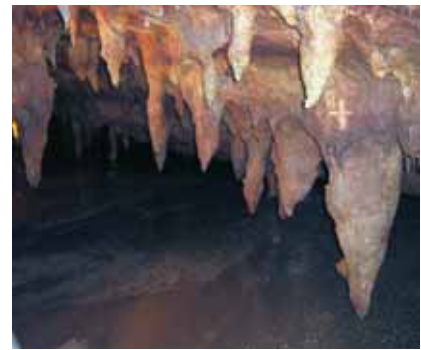
Σπήλαιο πηγών Αγγίτη: σταλακτίτες