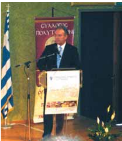
Ο Υπουργός Μακεδονίας – Θράκης κ. Μαρ. Τζίμας κηρύσσει την έναρξη των εργασιών του Συνεδρίου.

ρεάν επιμόρφωση των γονέων σε συγκεκριμένα θέματα όπως: προστασία των παιδιών κατά τη χρήση του διαδικτύου, ανάπτυξη περιβαλλοντικής – οικολογικής συνείδησης, κ.ά.