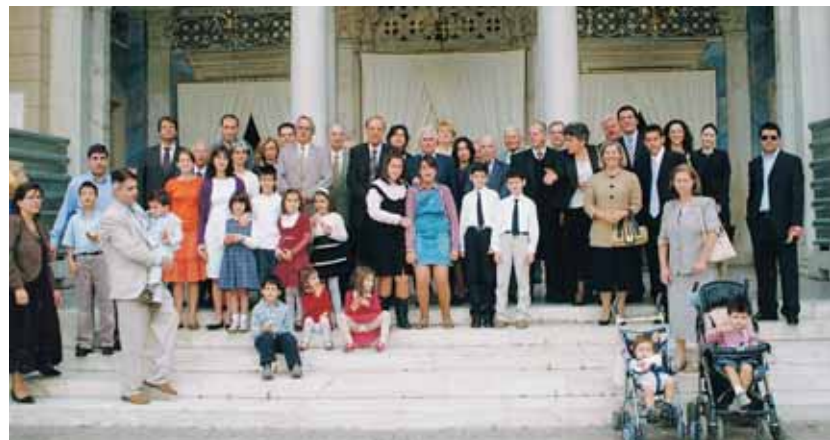
Από τον εκκλησιασμό των πολυτέκνων και την διανομή άρτου.