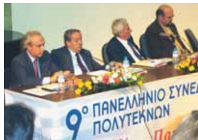
Άποψη από το τραπέζι ομιλητών της τελευταίας συνεδρίας

κή περιήγηση στο Σπήλαιο Πηγών Αγγίτη, ένα σπάνιο φυσικό μνημείο. Η απώτερη προϊστορία στην περιοχή του σπηλαίου αγγίζει τα 30.000 χρόνια πριν από σήμερα. Η χρονολόγηση αφορά στον ανώτερο ανασκαφικό ορίζοντα της τομής που έγινε στο πλάι της τεχνητής εισόδου. Η ανασκαφή που γίνεται εκεί, από την Εφορεία Παλαιoανθρωπολογίας - Σπηλαιολογίας από το 1992, έφερε στο φως λίθινα εργαλεία και οστά ζώων. Οι σύνεδροι ανανέωσαν το ραντεβού τους για το επό-