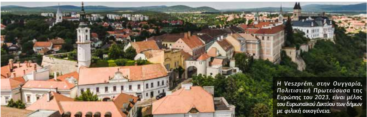
Η Veszprém, στην Ουγγαρία, Πολιτιστική Πρωτεύουσα της Ευρώπης του 2023, είναι μέλος του Ευρωπαϊκού Δικτύου των δήμων με φιλική οικογένεια.