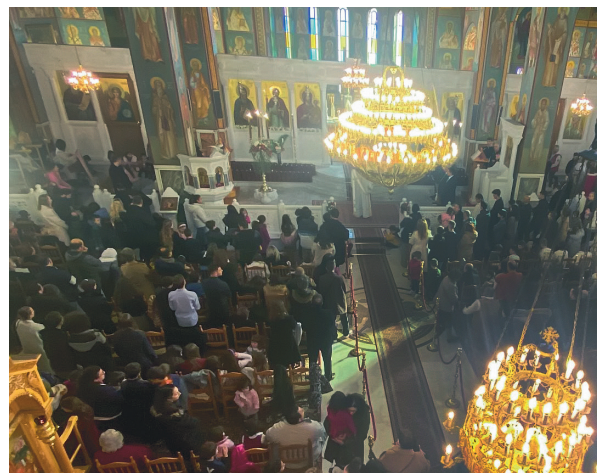
Συνέχεια από την σελίδα 1009

Την Παρασκευή 28 Ιουνίου, ο Σύλλογος πραγματοποίησε την ετήσια εορτητή βράβευσης των γονέων και των τέκνων τους στις σπουδές τους.